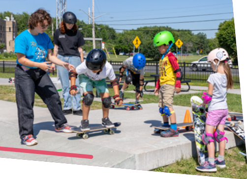
PLANCHE À ROULETTES